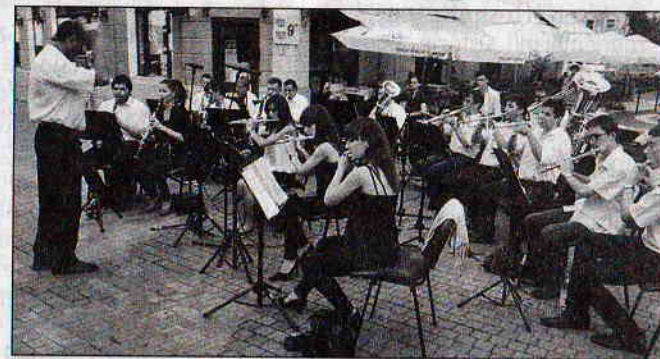
A Holnaposok szoborcsoportnál a Parádé Fesztivál örvendett sikernek

– Harmadik éve, hogy megrendezik. Ki volt az ötletadó?