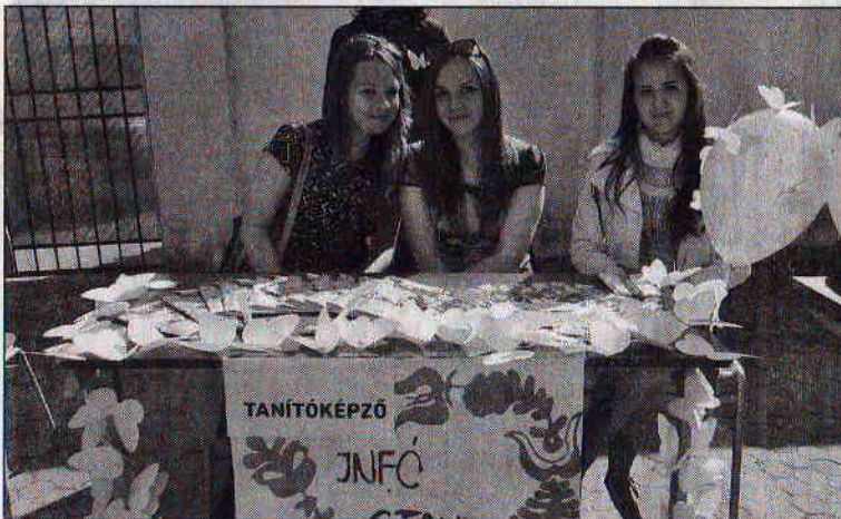
A PKE-n ősztől harmadik éve induló tanítóképző szak sajátossága, hogy a diákok számos lehetőség közül választhatnak

retnek gyermekekkel foglalkozni, jó szervezőkészséggel rendelkeznek, és szívesen csatlakoznának egy lelkes, aktív csapathoz.