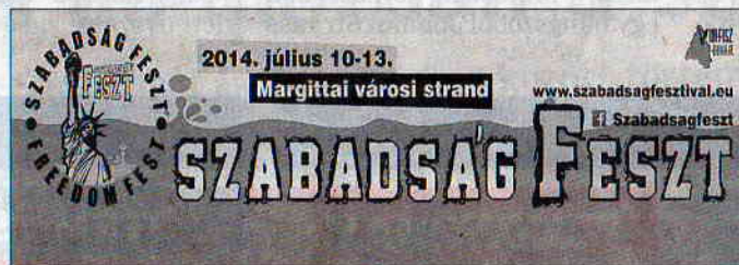
A Szabadság Fesztivált hirdető plakát

Csütörtök, 13 óra – Ka- punytás VIP kempingese- knek (welcome drink); 16:00 Kapunyitás; 18:00 Ugorj fe- jest a nyárba – vetélkedő; 19:30 Karaoke party; 21:30 Koncert – No Cable; 22:30 DJ party. Péntek, 8:30 óra –