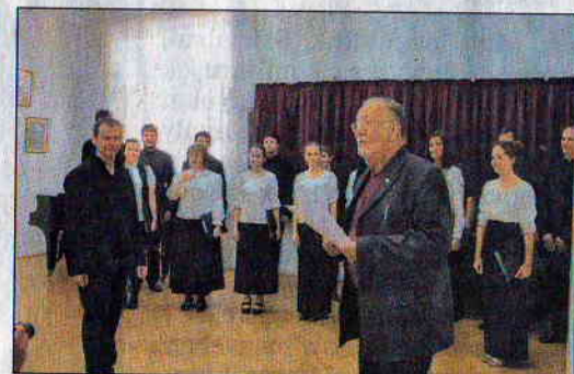
A PKE végzős hallgatóinak koncertje