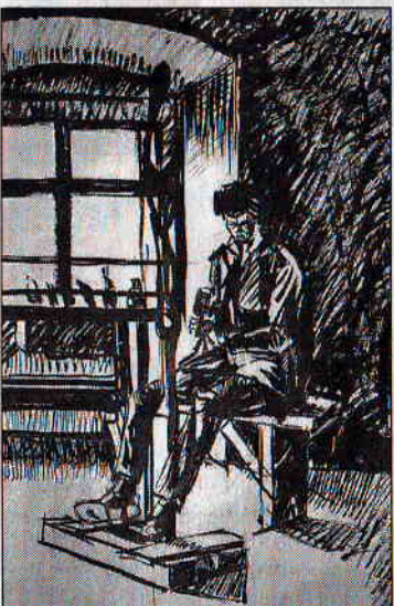
Bihari Barnabás egyik grafikája