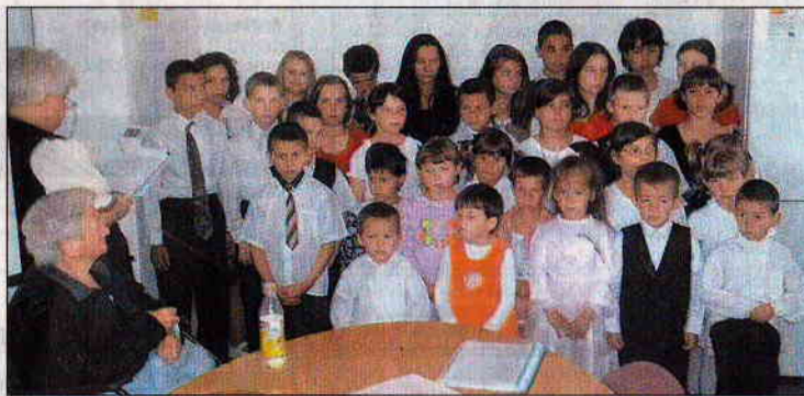
A gyereketthon lakói műsoruk előadása közben a templomban