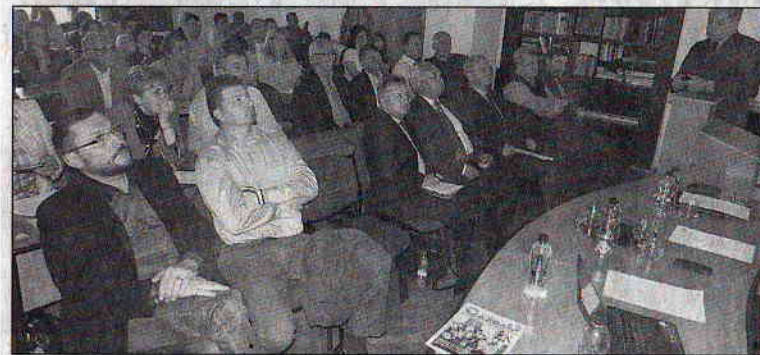
Mezőgazdasági szakemberek és agrár szakos hallgatók tanácskoztak