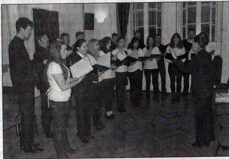
Kodály Zoltán-kompozíciókat adtak elő a Partiumi Énekkar tagjai