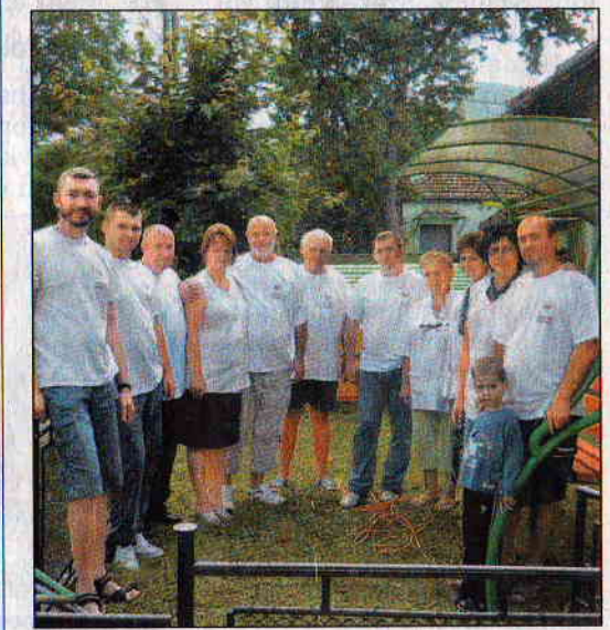
Diófásra ért a Tulipán Kaláka

Ami pedig a felvételt illeti: szaktól függően, különböző arányban számít az érettségi átlag, illetve a szaknak megfelelő érettségi tantárgyból kapott jegy, de van, ahol képességfelmérés, illetve felvételi beszélgetés is zajlik.