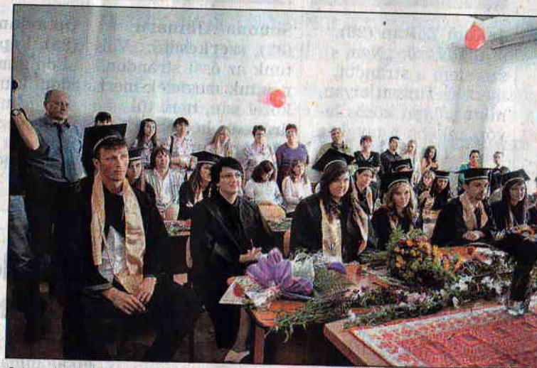
A társadalomtudományi képzés a Partiumi Keresztény Egyetem „intézményalapító” oktatási programjai közé tartozik

több rangos, uniós támogatással megvalósított határ menti kutatási programot bonyolított le (felsőoktatás, szociális szakemberek képzése, felnőttképzés). A programok oktatási szempontból is jelentősnek bizonyultak, hiszen a tapasztalatcserék, szakmai kirándulások, terepgyakorlatok és -kutatások mind hozzájárultak a hallgatók elméleti-gyakorlati tudásának elmélyítéséhez. A diákok szakmai szociálizációját egyébként évközi és év végi terepmunkák, intézménylátogatások is segítik, a