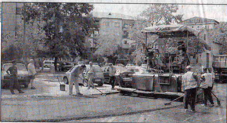
Az illetékesek ígérik: jövő hónapban végeznek a munkálatokkal

vízügy végzett a munkákkal. A vízügyi hivatalt is megkerestük. Az ő válaszuk így hangzik: Az olvasó által felsorolt utcákban a kohéziós alapokból finanszírozott Víz- és szennyvízhálózat kiterjesztése és rehabilitálása Bihar megyében projekt munkálatai zajlanak. Az építő cég, tekintve a szerződésben megszabott kivitelezési határidőt (2014.08.29), több munkacsoporttal egyidőben dolgozik, több fronton. Még nem került sor az eredetinek megfelelő útburkolat visszaállítására, mivel a kivitelezést végző Selina cég késedelemmel szerezte be a szerződésben megszabott anyagokat. Tekintettel a helyzetre a kivitelező benyújtotta a munkafolyamat pontos leírását, melyben vállalta, hogy 2013. november 29-én lezárja az összes megkezdett munkálatot.”