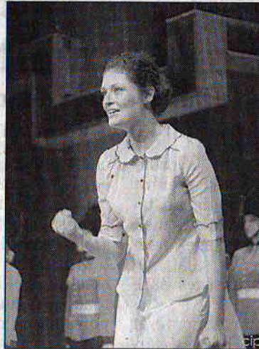
Újra műsorra tűzik a My Fair Ladyt

között, valamint egy órával az előadás előtt. Online jegyvásárlásra a színház honlapján ( www.szigligeti.ro ) illetve a www.biletmaster.ro oldalon van lehetőség.