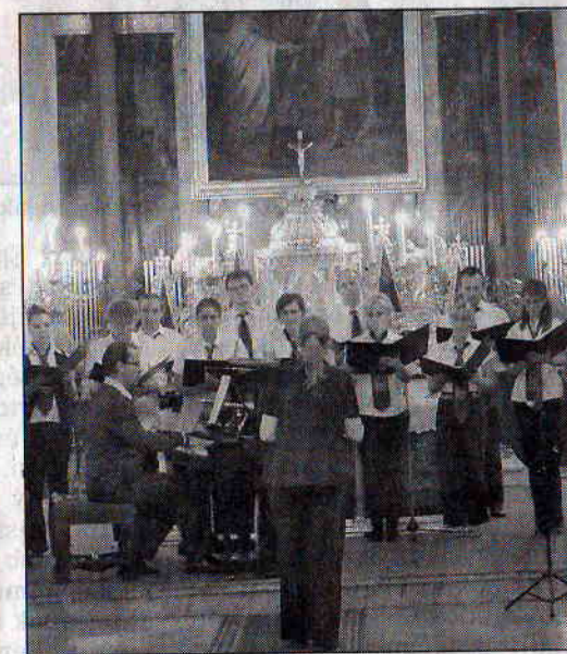
Hangversenyt tartottak a Szent László-temp-lomban