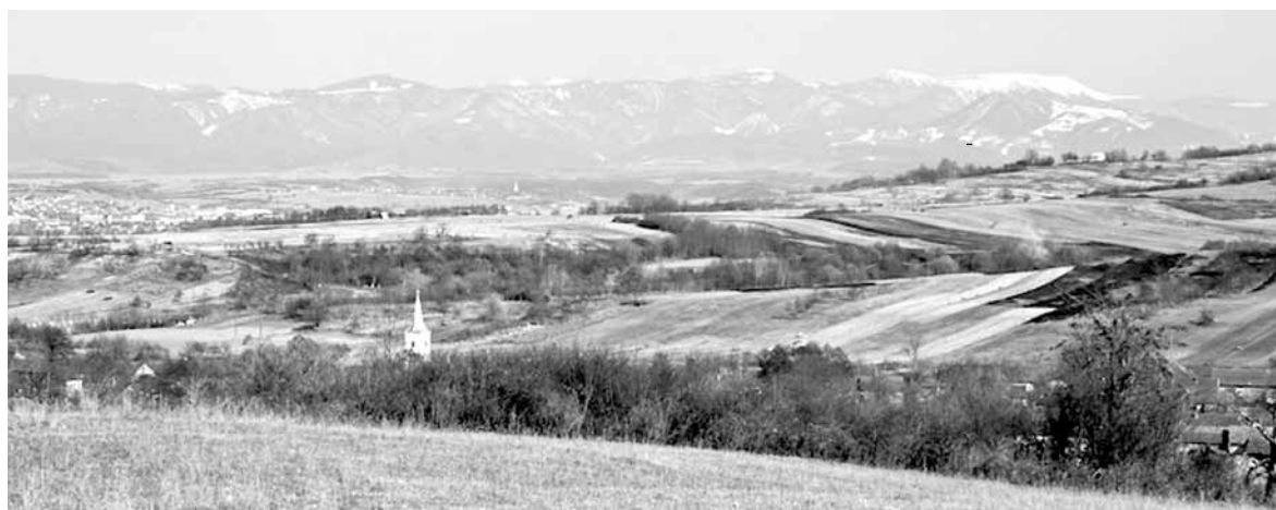
A Belényesi-medence