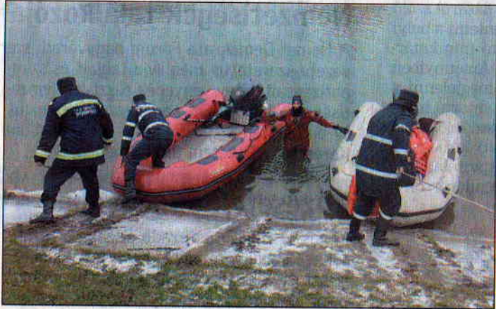
Látványos bemutatók is szoktak lenni az ilyen eseményeken

mos bemutatót nézhetnek meg. A váradi alegységet 1994. május 15-én alapították. A sürgősségi esetek száma és sokfélesége miatt az évek során új egységek jöttek létre a következő területeken: személyvédelem, tűzszerészet, személykeresés-mentés.