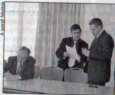
A tájékoztató egyik pillanata