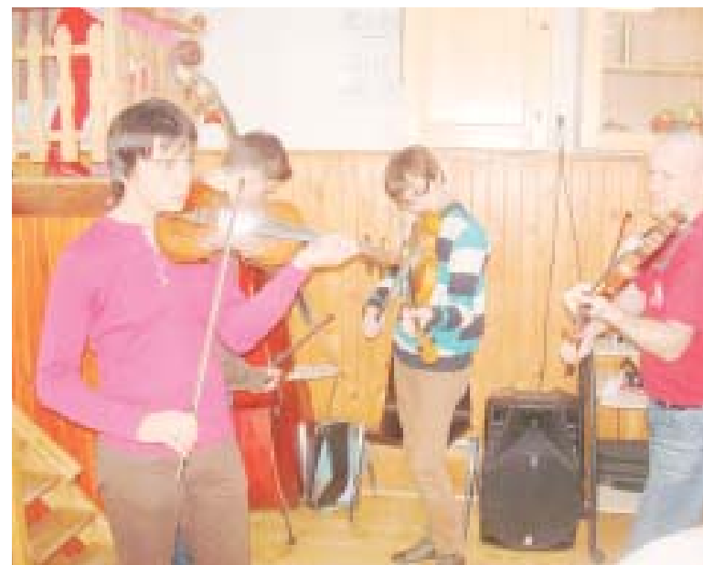
A Csillagocskák zenekar tagjai húsvéti dalt is tanítottak

De lehetett otthonról hozott főtt tojásokat is festeni, hímessé varázsolni vagy kifűjt tojásokból babát, esetleg nyuszt készíteni az óvoda által biztosított különféle kellékek segítségével. A szülők is beszálltak a tevékenységbe, talán ők még a gyerekeknél is jobban élvezték a kézműves-foglalkozást. A legtöbb anyuka és apuka a hurkapálcikákra tűzhető, tojás alakú piros kartonpapírra festett különféle motívumokat fehér temperával vagy csuhé-farktollú, tyúkocskák alakú tojástartót fabrikált piros taréjjal. Új-