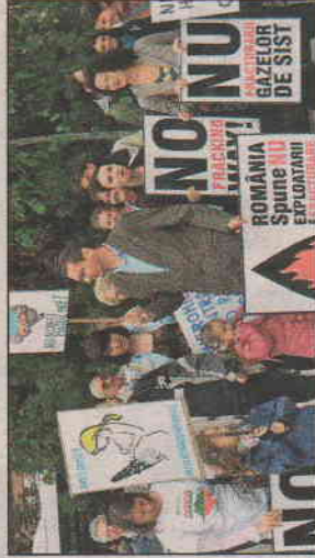
Volt, aki gyermekeivel ment el a tüntetésre

magasba, különböző, a palagáz-kitermelés, a verespataki bányaberuházás stb. elleni jelszavakat skandáltak. A tiltakozó megmozdulás incidensek nélkül zajlott le.