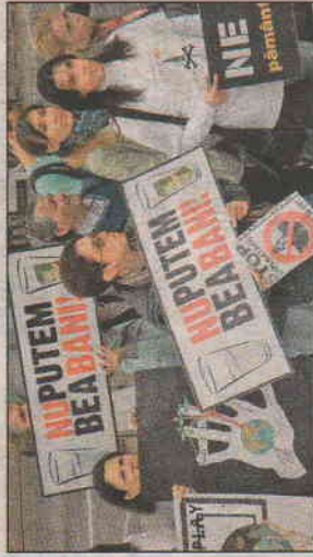
Transzparenseket tartottak a magasba