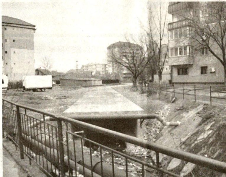
A Páris-patak mára egy bűzös szennyvízcsatornává változott