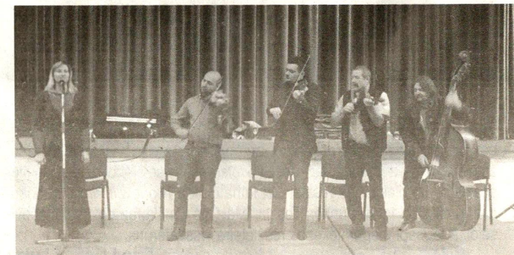
A Téka együttes