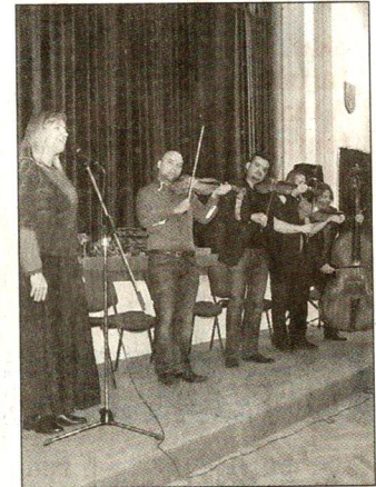
A kicsik is nagyon szerették a Téka muzsikáját