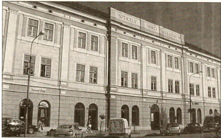
A sepsiszentgyörgyi Székely Mikó Kollégium épülete

rásban 3 éves felfüggesztett börtönrre ítélt Silviu Clim felbbezését pedig elutasította. A jogerős végzés eltörölte az