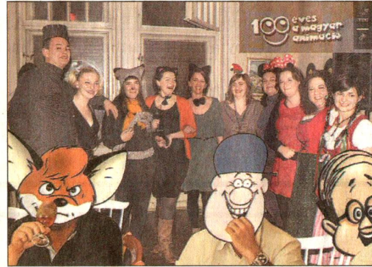
A jelmezes verseny témáját természetesen a magyar rajzfilmhősök szolgáltatták

filmet vetítettük. A rendező, Vladislava Planciková a háború utáni Csehszlovákiában élő szlovákok és a magyarok közötti képzeletbeli sakkjátszmát, a lakosságcsere témáját boncolgatja. „Az élő felvételeket, interjúkat, archív anyagokat animációs betétekkel ötvözi a film, amelyek az otthontalanság, gyökérvesztés megrázó traumáját teszik érzékletessé és átélhetővé a néző számára. Az emlékek szó szerint életre kelnek, régi fotók és tárgyak sejlének fel a