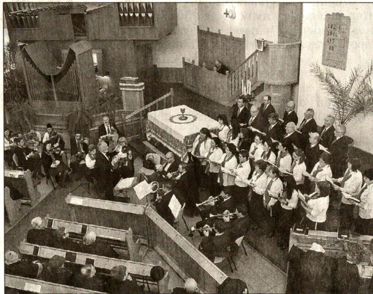
A Belvárosi 1. számú Magyar Baptista gyülekezet ének- és zenekara szolgált a rogériuszi templomban

szertetvendégséggel zárult. Az advent 3. vasárnapi ünnepi alkalomért is egyedül Istené legyen a dicsőség.