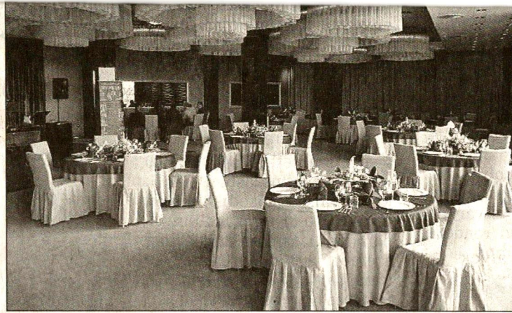
A Lotus bevásárlóközpont emeleti rendezvénytermében lesz a bál