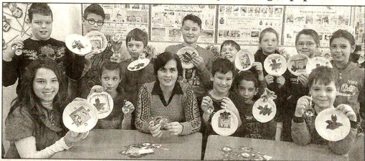
A diákokkal való foglalkozás vidám hangulatban telt.

Az idén a főszerep a karácsonyi csomagolópapírra esett.