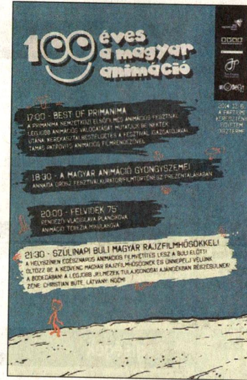
A rendezvény plakátja

BODEGA – 21:30 – Szülinapi buli magyar rajzfilmhősökkel! A helyszínen egész napos animációs filmvetítés lesz a buli előtt! Öltözz be a kedvenc magyar rajzfilmhősödnél és ünnepelj velünk a Bodegában! A legjobb jelmez tulajdonosa egy láda Hargita sörben részesül, a közönségdíjas jelmez pedig egy üveg borral gazdagodik, de más meglepetések is várhatóak.