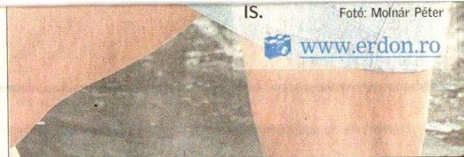
IS.