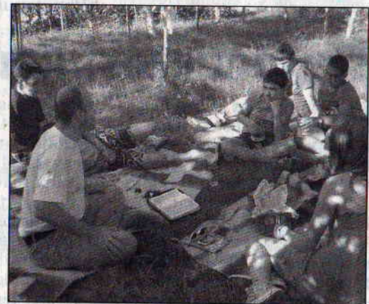
A pénteki bibliaórákat a nyár folyamán a szabadban tartják

Augusztus 4-én, szombat délelőtt a Biharsályiban található vízgyűjtő tavat kereste fel a várad-őssi ifisek kicsiny csapata, akik az idei konfirmációt követően, június 1-jétől a pénteki ifjúsági bibliaórákat látogatják. A rövid utazás közben megtekintettük egyik szórványunk, a lesi gyülekezet templomát. Biharsályiban pedig a helyi római katolikus templomról esett szó, melyben havonta kétszer gyűlnek össze istentiszteletre a helyi reformátusok. A továbbiakban a gyalogtúrát volt a főszerep, melynek során megkerültük a nagy kiterjedésű tó egy részét, s a kánikulai időjárás elől a közeli erdőben, majd a tó vizében találtunk enyhülést. Köszönjük Istennek, hogy a bibliaórák mellett kirendelte számunkra az együtt töltött időt, a vidám perceket és az örömteli nyári szórakozást is.